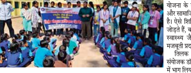
इस अवसर पर पर्यावरणविद एवं मानव जीवन विकास समिति कार्य करने हेतु प्रेरित किया।आज के बौद्धिक सत्र में फ्रांस से आए

शासकीय तिलक स्नातकोत्तर महाविद्यालय, कटनी द्वारा बिजौरी ग्राम स्थित मानव जीवन विकास समिति के प्रांगण में आयोजित राष्ट्रीय सेवा योजना महिला व पुरुष इकाई के विशेष नेतृत्व प्रशिक्षण शिविर में विविध सामाजिक एवं शैक्षणिक गतिविधियों का आयोजन किया गया। शिविर के अंतर्गत राहत सेवा समर्पण संस्थान, विजयराघवगढ़ के सहयोग से नेत्र जांच एवं स्वास्थ्य परीक्षण शिविर का आयोजन किया गया, जिसमें 125 विद्यार्थियों सहित प्रांगण में उपस्थित ग्रामीणजनों की आंखों की जांच की गई। इस पहल को स्थानीय लोगों ने सराहनीय बताया।